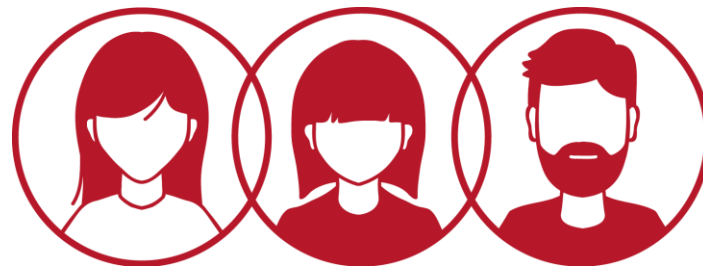
Rada programowa ciało opiniotwórcze