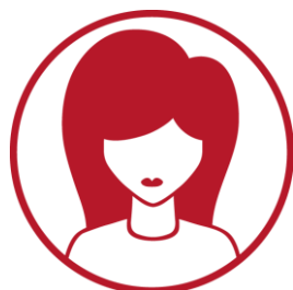
Wykładowca prowadzi wykład w 1 obszarze tematycznym oraz sprawuje opiekę merytoryczną nad warsztatami oraz daje wytyczne do pracy w firmie