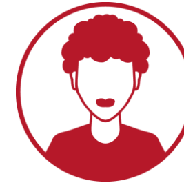
Ekspert tematyczny zapewnia wsparcie merytoryczne w zidentyfikowanych obszarach problemowych przedsiębiorstwa (punktowo)