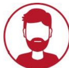
Ekspert ds. metodyki prowadzi kurs w zakresie metodyki: 1. Business Model Canvas 2. Design Thinking 3. Open Innovation