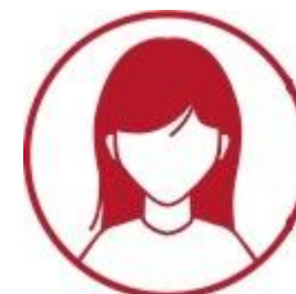
Doradca wspiera uczestników AMI w tzw. pracy w firmie – podaje przykłady, wskazuje kierunki, pomaga szukać rozwiązań, ale nie wykonuje pracy za uczestników (pracuje z firmą przez cały okres udziału w AMI)