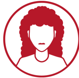
Ekspert ds. gry strategicznej prowadzi grę strategiczną podczas zjazdu otwierającego