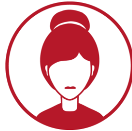
Warsztatowiec prowadzi warsztaty