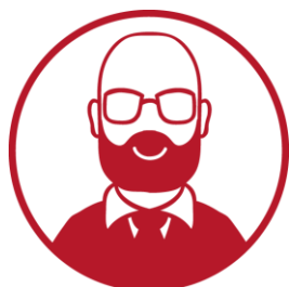
Ekspert zagraniczny wysokiej klasy praktyk prowadzi wykład otwierający AMI oraz wykład zamykający AMI