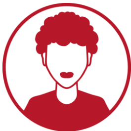
Dyrektor ds. programowych sprawuje nadzór merytoryczny nad programem AMI