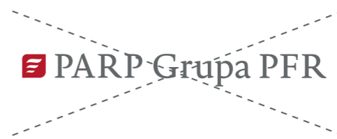
niedopuszczalna zmiana układu literownictwa